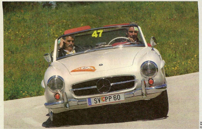
Gut erhaltene Old- und blitzblank polierte Youngtimer sind am 10. Juli im Bezirk St. Veit zu sehen

106. Kirchtag beim Wimitzwirt, Familie Solic, 10.30 Uhr Festmesse, anschl. Frühschoppen